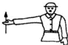
Рис.7. Поднять колено (стрелу)