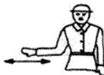
Рис.6. Указание направления