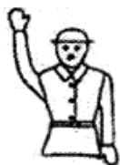
Рис.1. Готовность подавать команду